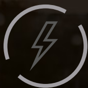
System zasilania MOZA SPARK