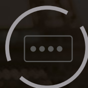
System szybkiego montażu